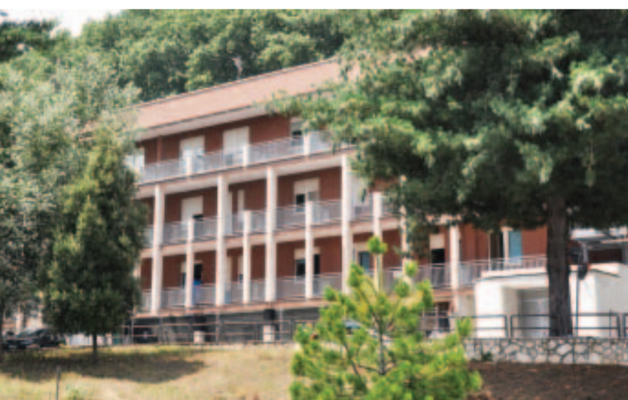
La casa di cura Montevergine. Con questo progetto la sanità si apre alle attività di Fondimpresa