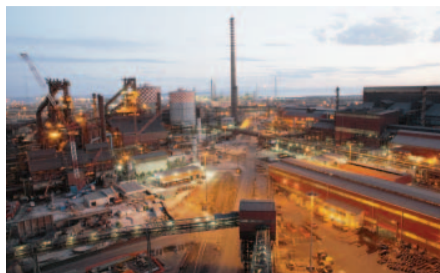
Ilva. Per il gruppo di Taranto 15 milioni di mq e 14mila persone tra dipendenti e ditte esterne