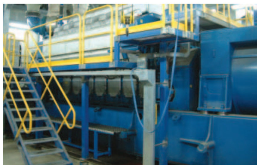
La Smede. L'azienda che opera a Pantelleria è una delle dodici coinvolte dal progetto "Isola"